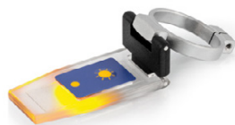
Tapa Prisma ORA-A1101