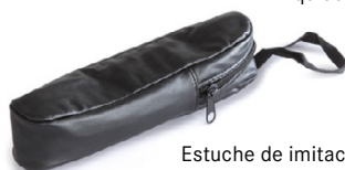
Estuche de imitación de cuero ORA-A2103